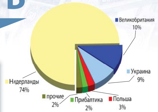
Структура реализации ЗАО «БНК» по продуктам в I полугодии 2009 года